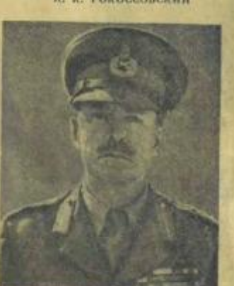
Верховный Главнокомандующий силами союзников на средиземноморском театре фельдмаршал Гарольд АЛЕКСАНДЕР