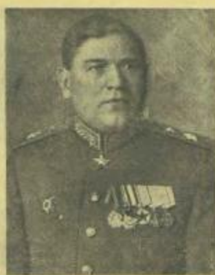
Маршал инженерных войск М. П. ВОРОБЬЕВ