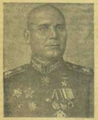
Маршал Советского Союза И. С. КОНЕВ