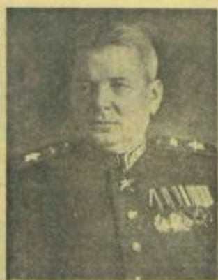
Маршал бронетанковых войск Я. Н. ФЕДОРЕНКО