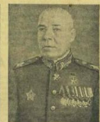
Маршал Советского Союза С. К. ТИМОШЕНКО