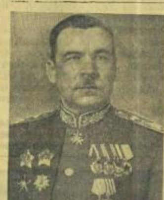
Маршал Советского Союза Л. А. ГОВОРОВ