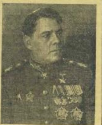
Маршал Советского Союза А. М. ВАСИЛЕВСКИЙ