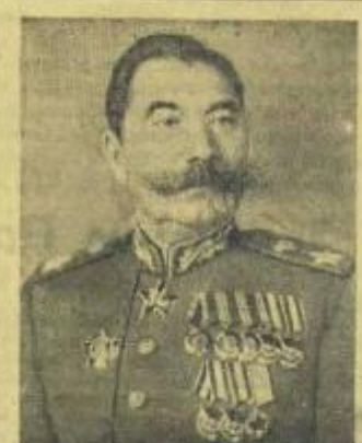
Маршал Советского Союза С. М. БУДЕННЫЙ