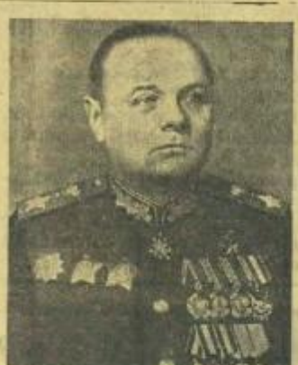
Маршал Советского Союза К. А. МЕРЕЦКОВ