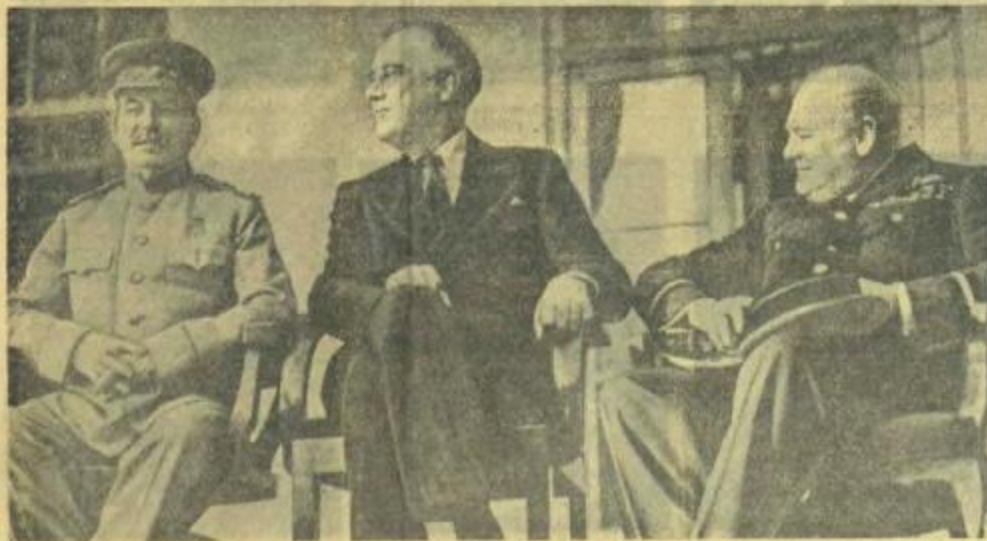
Главы Объединенных наций — И. В. Сталин, Ф. Д. Рузвельт и У. Черчилль в дни Тегеранской Конференции.

В светелство выходящего и поставил свои поздравки и «сердил ее печать Соединенных Штатов Америка».