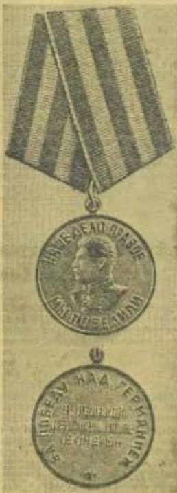
Медаль «За победу над Германией в Великой Отечественной войне 1941—1945 гг.»

1. Медалью «За победу над Германией в Великой Отечественной войне 1941—1945 гг.» награждаются: а) все военнослужащие и лица вспомогательного штатного состава, принимавшие в рядах Красной Армии, Военно-Морского Флота и войск НКВД непосредственное участие на фронтах Отечественной войны или обеспечивавшие победу своей работой в военных округах; б) все военнослужащие и лица вспомогательного штатного состава, служившие в период Великой Отечественной войны в рядах действующей Красной Армии, Военно-Морского Флота и войск НКВД, но вышедшие из них по ранениям, болезням и увечью, а также переопределенные по решению государственных и партийных организаций на другую работу вне армии.