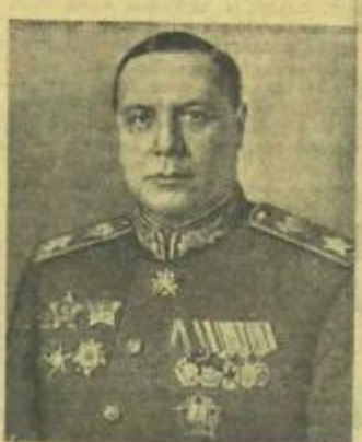
Маршал Советского Союза Ф. И. ТОЛБУХИН