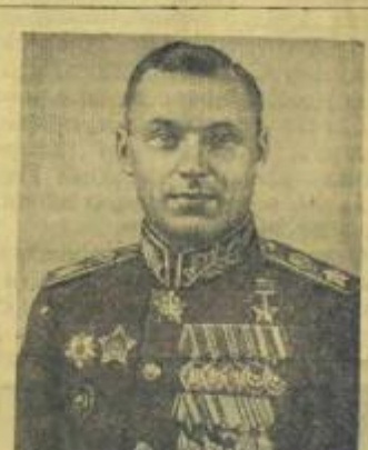
Маршал Советского Союза К. К. РОКОССОВСКИЙ