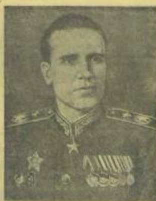
Главный маршал авиации А. Е. ГОЛОВАНОВ