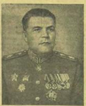
Маршал Советского Союза Р. А. МАЛИНОВСКИЙ