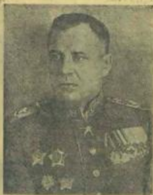
Главный маршал авиации А. А. НОВИКОВ