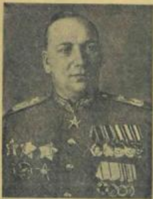
Главный маршал артиллерии Н. Н. ВОРОНОВ