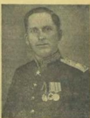
Маршал войск связи Н. Я. ПЕРСЫНКИН