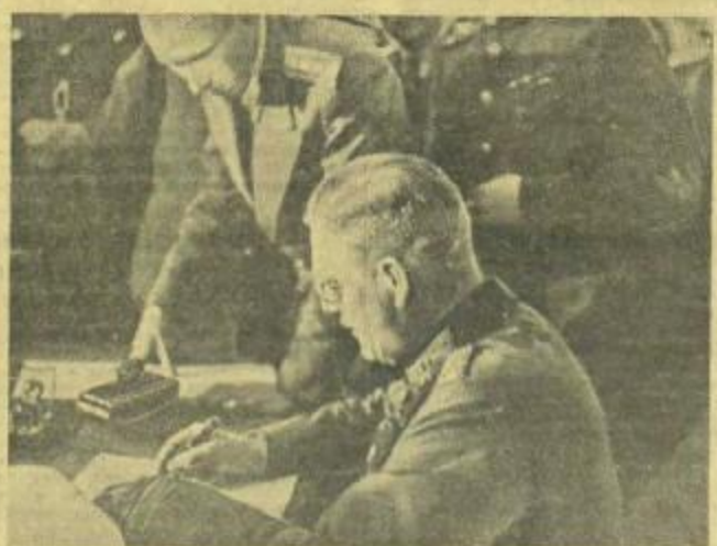
ПОДПИСАНИЕ АКТА О БЕЗОГОВОРНОЙ КАПИТУЛЯЦИИ ГЕРМАНСКИХ ВООРУЖЕННЫХ СИЛ. 1. Маршал Советского Союза Г. Жуков, глава делегации Верховного Командования союзников главными маршал авиации А. Теллер, генерал К. Смитс и другие в зале, где происходило подписание акта. 2. Кейтель подписывает акт о капитуляции. (Доставлены на самолете летчиком гвардии подполковником Семениковым).