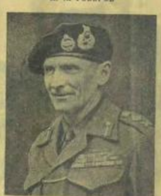
Командующий 21-й армейской группой фельдмаршал Бернар МОНТГОМЕРИ