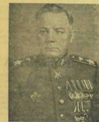
Маршал Советского Союза К. Е. ВОРОШИЛОВ