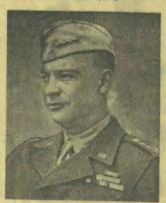
Верховный Главнокомандующий экспедиционными силами союзников генерал армии Дуйет ВЕНЗХАУЗЕР