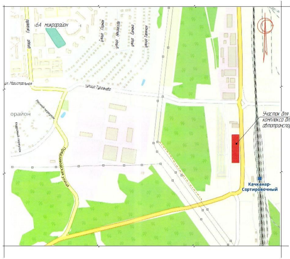
Схема размещения объекта строительства (1 ая очередь) в границах отведенного земельного участка. М 1 : 400.